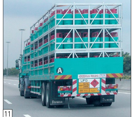
Transporte fácil y seguro de los cilindros de gas en paletas