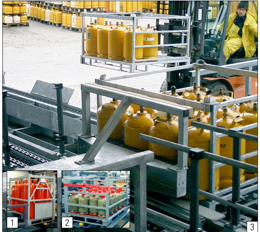
Manejo fácil y seguro de los cilindros de gas en paletas