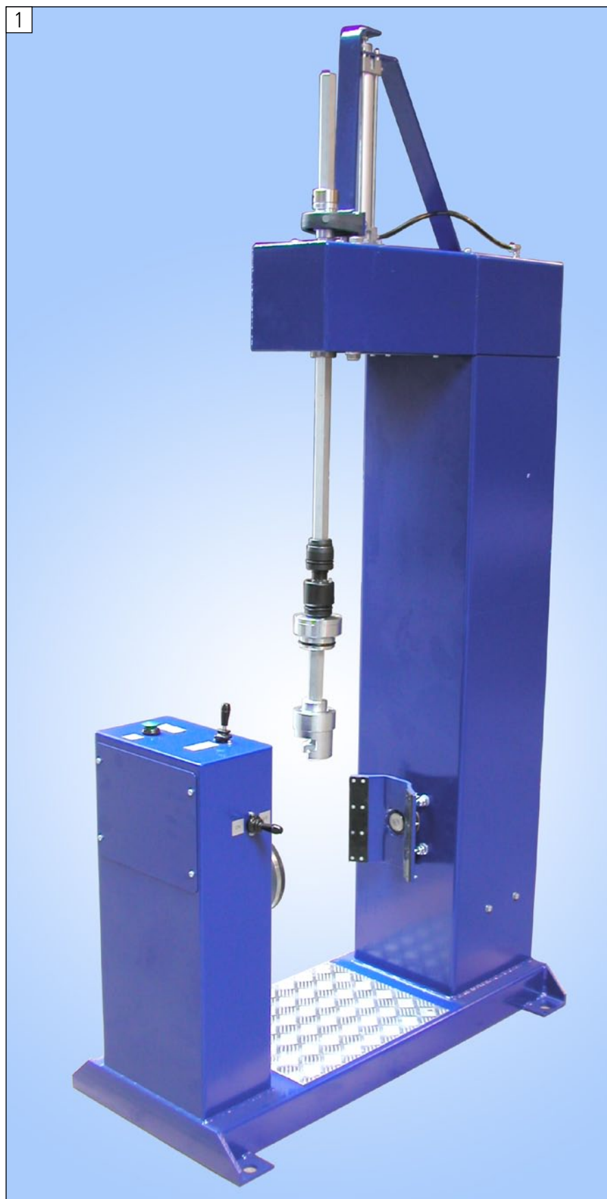
Machine à remplacer les robinets PVS pour installation stationnaire au sol