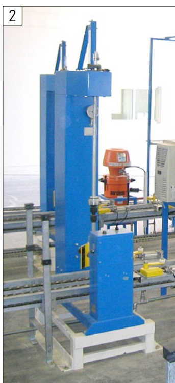
Machine à remplacer les robinets PVS pour installation en convoyeur à chaîne