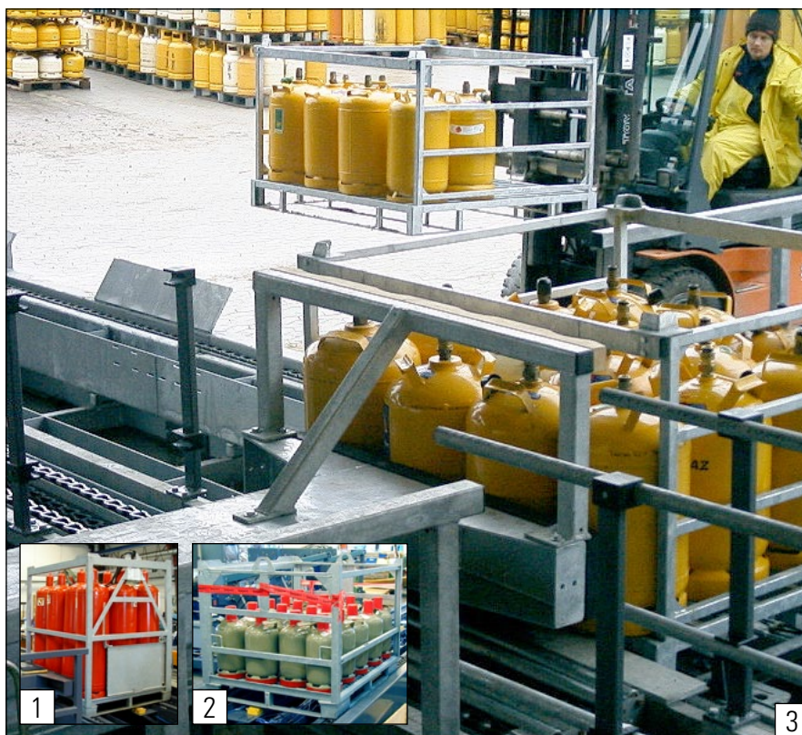
Manutention sûre et facile de bouteilles de gaz en palettes