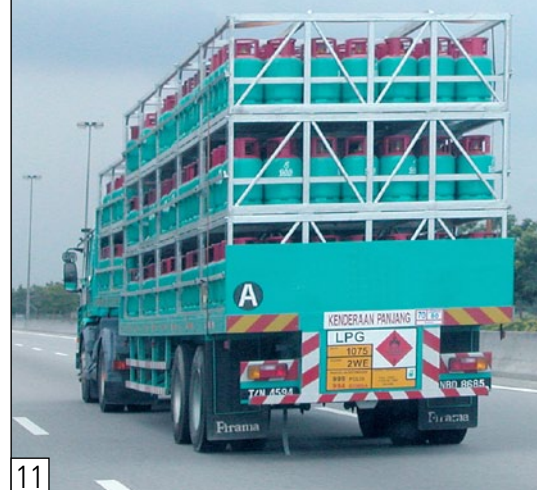
Transport sûr et facile de bouteilles de gaz en palettes